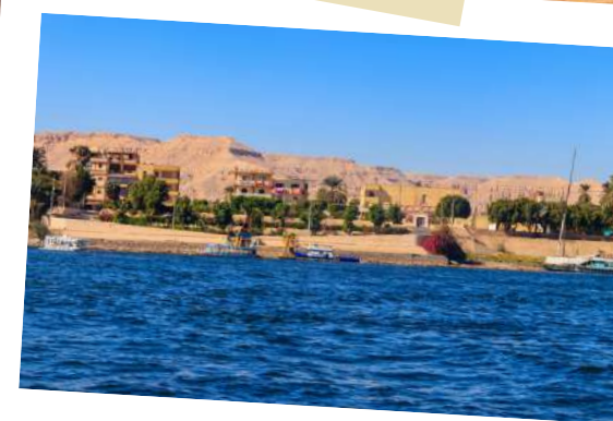
Vrije tijd doorbrengen aan de oevers van de iconische Nijl.

Caïro, een steenworp van een wereldwonder