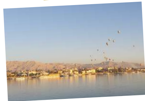
Vanop de Nijl-oeveren zien we kleurrijke luchtballonnen opstijgen.

Tijdens haar reizen staat verbinding centraal: met de cultuur, met de lokale bevolking én met de medereizigers onderling natuurlijk. Petra nodigt haar reisgezelschap dan ook uit om hun vooroordelen thuis te laten en bestemmingen te beleven met een open hart.