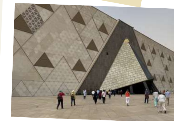
De ingang van het Grand Egyptian Museum

Na een bezoek aan de imposante stuwdam en de onafgewerkte obelisk vliegen we terug naar Caïro. De volgende dag bezoeken we het gloednieuwe Grand Egyptian Museum, met 's werelds grootste collectie Egyptische artefacten en de legendarische schat van Toetanchamon, met als decor de piramides van Gizeh. Daarna trekken we naar de citadel voor de Mohammed Ali Moskee, dwalen door het historische Koptisch Caïro en sluiten de dag af in de bruisende steegjes van de Khan El Khalili-bazar.