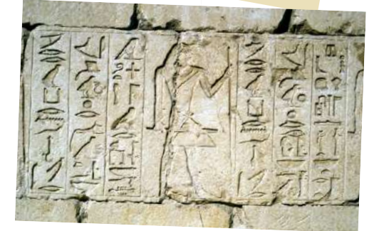
Tolk hiërogliefen zal je nog net niet worden op 10 dagen

Caïro, een steenworp van een wereldwonder