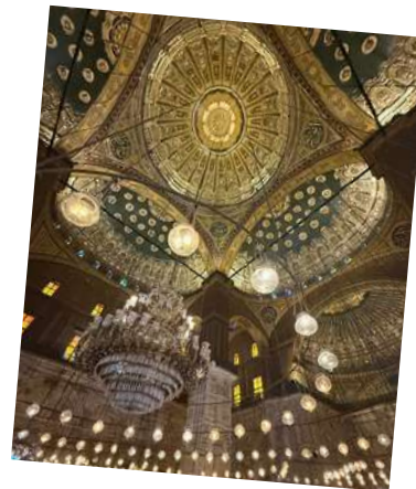
De prachtige Albasten Moskee in Caïro