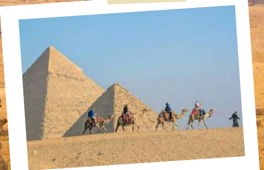
Piramides van Gizeh