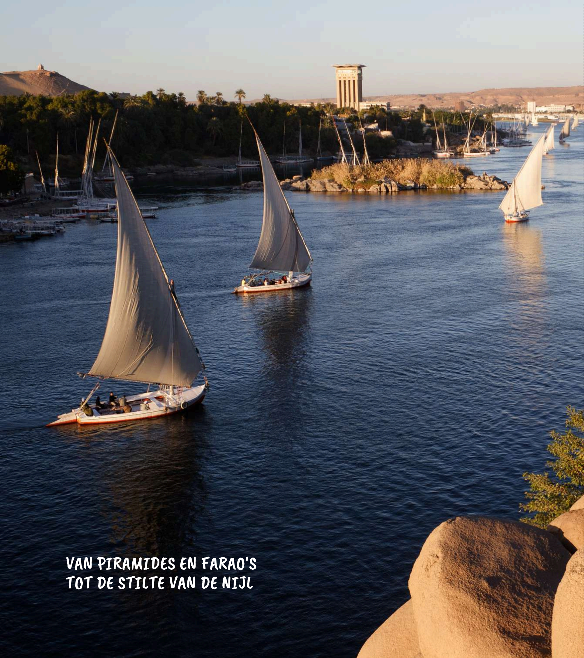
Egypte - Het land van de farao's langs de Nijl

VAN PIRAMIDES EN FARAO'S TOT DE STILTE VAN DE NIJL