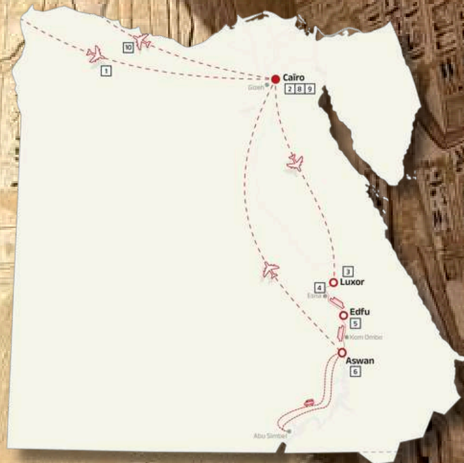
Egypte - Het land van de farao's langs de Nijl

Caïro voor de piramides en het Grand Egyptian Museum, gevolgd door 4 nachten op een cruise van Luxor naar Aswan.