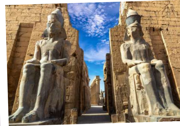
De imposante tempel van Karnak

We zetten koers naar de Westelijke Oever, waar de Vallei der Koningen, de tempel van Hatsjepsot en de kolossen van Memnon ons diep onder de indruk laten. In Edfu bezoeken we de imposante tempel van de valkgod Horus, met zijn mythologische muurschilderingen van de strijd tussen Horus en Seth. In Kom Ombo bewonderen we de unieke dubbele tempel, gewijd aan de krokodillengod Sobek en de valkengod Harweris, waar zelfs oude chirurgische instrumenten en een rituele kalender op de muren zijn uitgebeeld. Daarna varen we verder richting het bruisende Aswan.